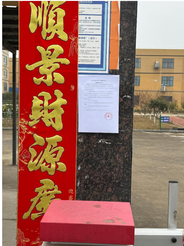
图 2 第二次网络公示