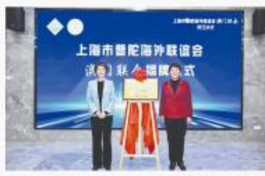
揭牌仪式现场。

4000余万元人民币，实施共富项目50余个，落地“暖心小岛一件事”20余件，开展各类为民服务活动180余次，惠及海岛民众6.1万余人次。一亩滩小岛，铁脚不停，一件件小事，暖心的温度不减。海岛发展不仅承载着海岛民众的共富梦想，更多的是他们对美好生活的向往。走在共富路上，“小岛你好”正响彻舟山更多小岛。