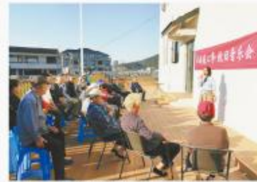
民建舟山市委会赴结对岛——东旭岛开展冬日音乐会。

如上故事仅是舟山统一战线为民办实事的一个生动场景。让民众有实实在在的获得感，是舟山统一战线对“何以振兴小岛”的持续思考。近年来，为扎实推进“同心共富”工程，助力“小