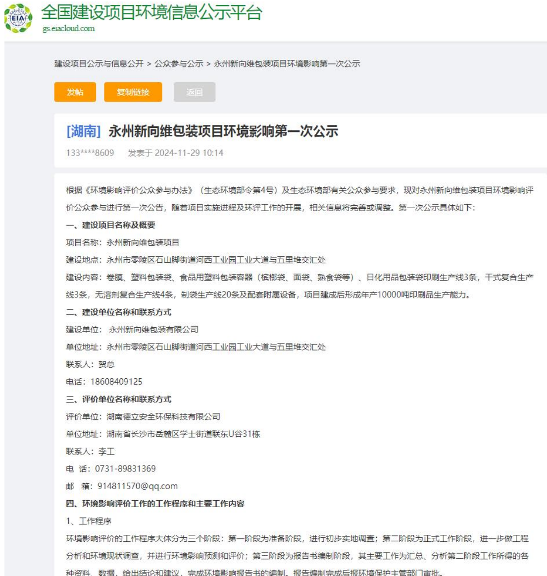
图 1 第一次网上公示截图

首次公示为网络平台公示，在“全国建设项目环境信息公示平台”（ https://www.eiacloud.com/gs/detail/3?id=41129eXiJK ）发布了本项目环境信息第一次公示，第一次网络平台公示见图 1。