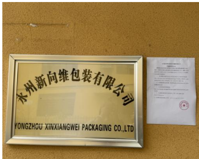
图3 现场张贴公告公示